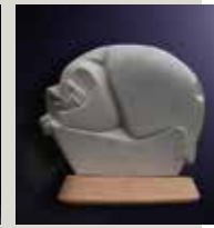
Alfredo Pecile Scultore San Giorgio della Richinvelda (PN)